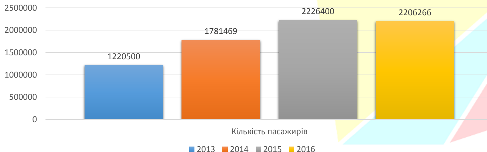
Пасажиропотік до та з Міжнародного аеропорту Кишинів у 2013-2016 роках