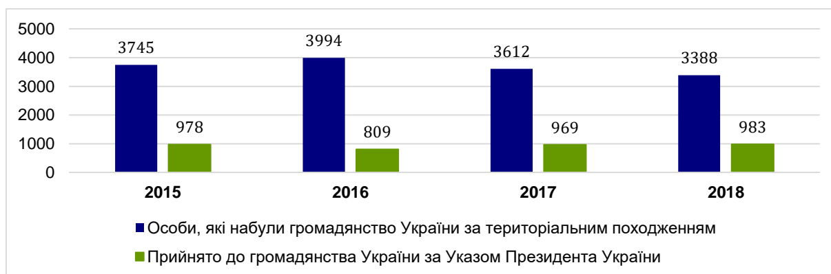
Діаграма 2. Набуття громадянства за територіальним походженням і внаслідок прийняття до громадянства, 2015-2018 р.

Для подолання бюрократичних бар'єрів необхідним є розвиток системи електронної черги для іноземців, запровадження сервісу перевірки стану оформлення документа на зразок того, що діє для біометричних документів громадян України, збільшення кількості інспекторів підрозділів ДМС, які приймають документи, у відповідності до попиту на оформлення документів для іноземців, запровадження послуг для іноземців у ЦНАПах, створення актуального переліку держав, законодавство яких передбачає автоматичне припинення особами громадянства одночасно з набуттям громадянства іншої держави. Не менш важливим є розгляд системних питань, зокрема політики мовної інтеграції іноземців, політики щодо подвійного громадянства і врегулювання проблем подальшої легалізації в Україні ветеранів АТО і ООС.