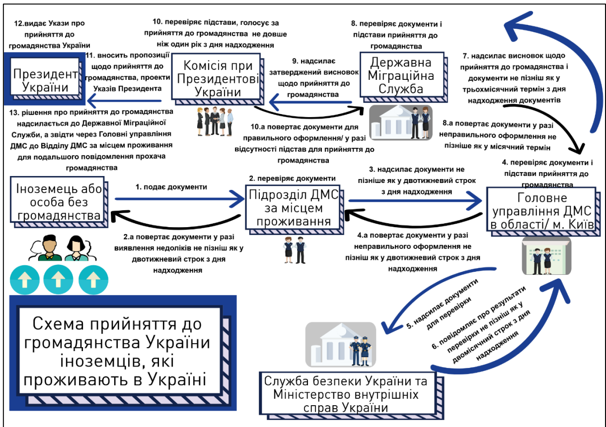
Рис. 2. Схема прийняття до громадянства України

За свідченнями респондентів, процедури винесення рішення зазвичай відповідають законодавчим нормам. Однак деякі опитані, які отримали свої документи до 2018 року, зіштовхнулись із повторною подачею документів через відсутність бланків для посвідок на постійне проживання. Один із респондентів розповів про неофіційні платежі за «прискорення» оформлення посвідок на постійне проживання в Україні, які були актуальними до 2018 року, коли відбулось скорочення термінів оформлення посвідок на проживання до 15 днів. За його словами, неофіційна ціна пришвидшення оформлення посвідки (від двох до шести місяців) у Харкові могла сягати 1500 доларів. Також один з іноземців стикався із необхідністю здійснити фінансовий внесок до одного з діючих благодійних фондів через тиск правоохоронних органів у процесі оформлення посвідки на постійне проживання.