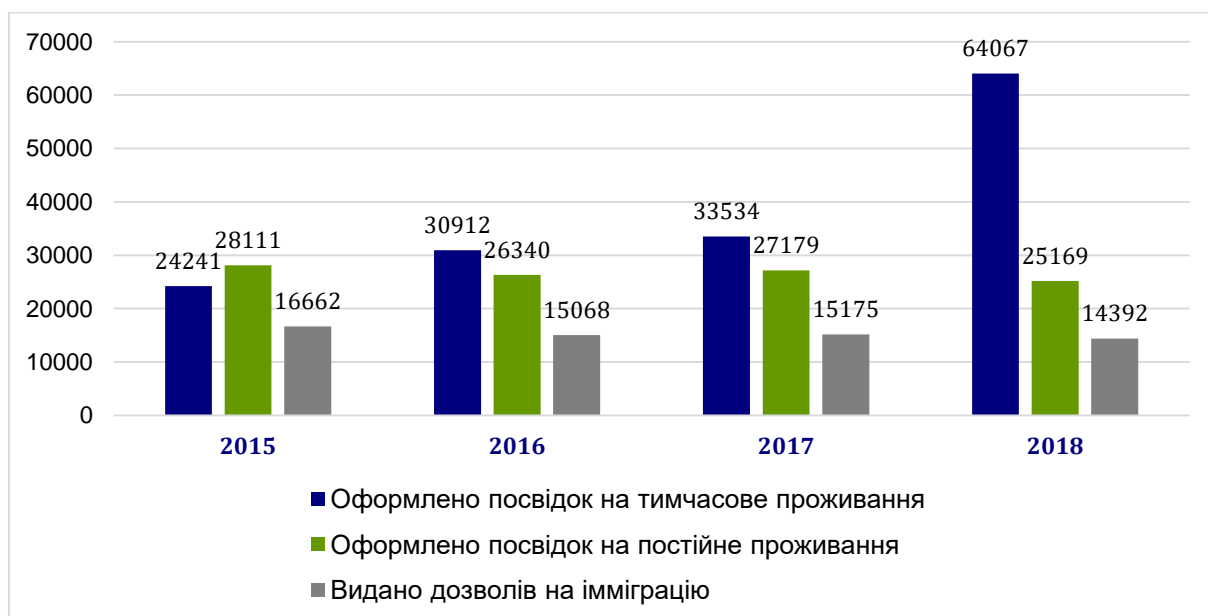
Діаграма 1. Оформлення посвідок на тимчасове та постійне проживання і дозволів на імміграцію в Україні, 2015-2018 р.

Підсумовуючи, слід зазначити, що останні зміни до законодавства у сфері спрощення порядку працевлаштування іноземних працівників разом з іншими новелами сприяли суттєвому зростанню попиту на посвідки на тимчасове проживання в Україні. Натомість, зміни до порядку набуття громадянства військовослужбовцями-іноземцями не мали суттєвого ефекту. Загалом, законодавчі новели не торкнулись питань формування квоти на імміграцію, оформлення дозволів на імміграцію та посвідок на постійне проживання, що підтверджується відносно сталими низькими показниками надання цих послуг у 2015-2018 роках. А це ще раз підтверджує те, що пріоритетами державної міграційної політики України було залучення іноземців лише на тимчасовій основі, тоді як важливою є реалізація нової Стратегії державної міграційної політики, що вказує на необхідність узгодження імміграційного законодавства з економічною та демографічною політикою держави, а також перегляд доцільності формування квоти імміграції.