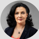
Іванна Климпуш-Цинцадзе, народний депутат України, голова Комітету Верховної Ради України з питань інтеграції до Європейського Союзу

Україна також провела офіційний скринінг за Розділом 1 «Вільний рух товарів» , у межах якого було презентовано прогрес у приведенні законодавства у сфері технічного регулювання транспорту у відповідність до стандартів ЄС. Заступник Міністра розвитку громад та територій Сергій Деркач наголосив: «розділи технічного регулювання на транспорті – одні з найскладніших для скринінгу на відповідність вимогам ЄС» , проте навіть в умовах війни Україна демонструє поступ у цій сфері. Під час зустрічі з Єврокомісією у Брюсселі 4–5 березня він презентував вимоги до сертифікації колісних транспортних засобів та рівень відповідності українського законодавства регламентам ЄС 2018/858, 168/2013, 2016/1628 та Директиві 2013/53 12 .